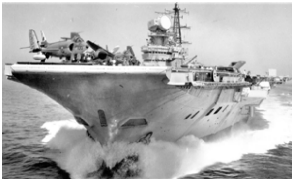
HMS Hermes, buque insignia de la Royal Navy en Malvinas. Los documentos desclasificados recientemente revelaron que transportó 18 armas nucleares a la guerra con Argentina

potenciales daños que podrían haber ocasionado. De hecho, Margaret Thatcher barajó la posibilidad de utilizarlas sobre territorio argentino como último recurso si las fuerzas de su país estaban en problemas. Un acta del Ministerio de Defensa británico, fechada el 6 de abril de 1982, habla de la “gran preocupación” de que algunas de las “bombas nucleares de profundidad” pudieran “perdersse o dañarse y el hecho se hiciera público”. El HMS Hermes que transportó 18 de las 31 armas nucleares fue el buque insignia de la fuerza británica durante el conflicto bélico de Malvinas. Sin embargo, para 1982 estuvo a punto de ser retirado del servicio debido a que llevaba varias décadas dentro de la Marina. La construcción de la nave comenzó en medio de la Segunda Guerra Mundial; en 1945 fue suspendida, se reanudó en 1952 y al año siguiente fue botado para entrar en la Royal Navy. Luego permaneció cuatro años en astillero para que se le instalara una plataforma de aterri-