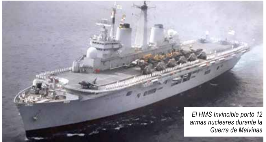
El HMS Invincible portó 12 armas nucleares durante la Guerra de Malvinas