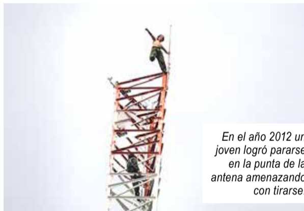
En el año 2012 un joven logró pararse en la punta de la antena amenazando con tirarse.

Nacional como escenario de potenciales suicidios, uno de ellos, ocurrido en el año 2012, se constituyó en emblemático por el riesgo que no solo corrió el temerario joven que logró pararse en la punta misma de la antena sino también la gran cantidad de bomberos, policías y