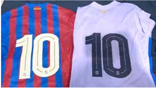
El "Messi fueguino" del Barca, en versión hockey pista.

campeones ascendiendo al Europeo A de Sala". "En lo personal estoy muy motivado y con ganas de arrancar a competir. Me encantaría que podamos ganar todo lo que juguemos, pero sabemos que tenemos dos torneos que son durísimos y con equipos muy fuertes. Las ganas e ilusiones están intactas para llegar lo más lejos posible, entregando el 100% para ayudar en todo lo que pueda al equipo", finalizó. En cuanto al Campeonato de España, el máximo certamen del país, Elei-