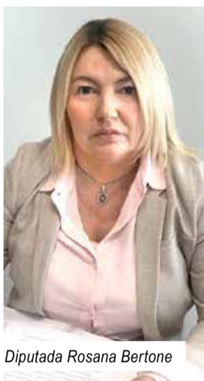
Diputada Rosana Bertone

La diputada nacional Rosana Bertone destacó la importancia de incluir en el temario del período de sesiones extraordinarias al proyecto tendiente a crear la “Ley de Promoción de la Formación y del Desarrollo de la Enfermería”. La ex gobernadora fueguina señaló “mi acuerdo absoluto con la decisión del presidente Alberto Fernández de incluir el proyecto de desarrollo de la enfermería para su tratamiento urgente ya que ha quedado claro en estos años que el fortalecimiento del sistema de salud debe ser una prioridad de la Nación y de cada una de las provincias, y que en ese marco el rol de los