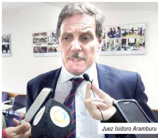
Juez Isidoro Aramburu

El Juzgado Electoral de Tierra del Fuego, a cargo del magistrado Isidoro Aramburu, aprobó el cronograma electoral de las Elecciones Municipales Extraordinarias 2022, en el que se establecen