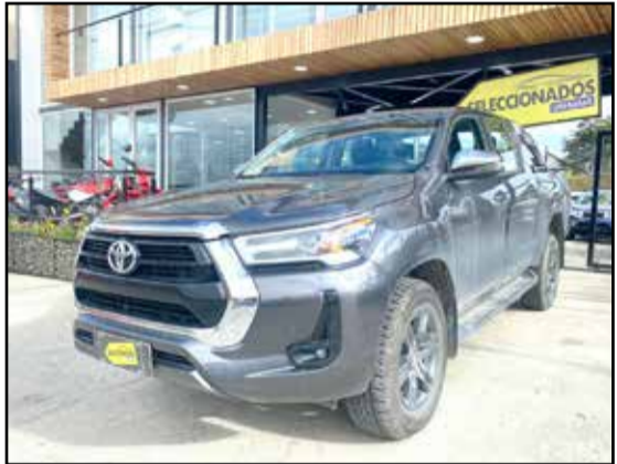
HILUX SRV 4X4 MT DC 2021 KM 7000. $ 8.990.000