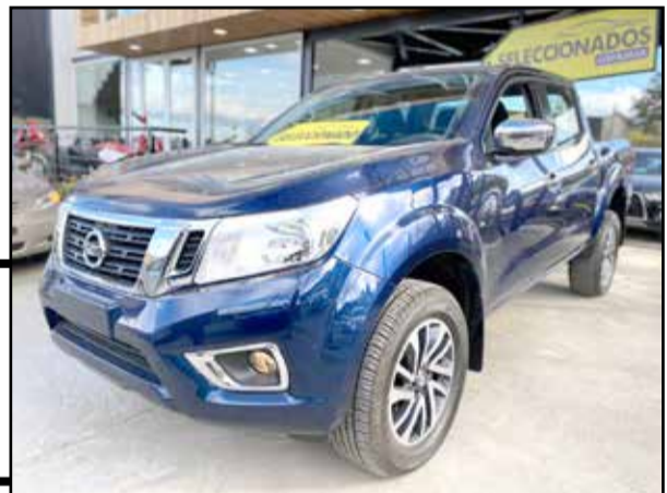
NISSAN FRONTIER XE MT 4X4 DC 0 KM. $ 7.100.000