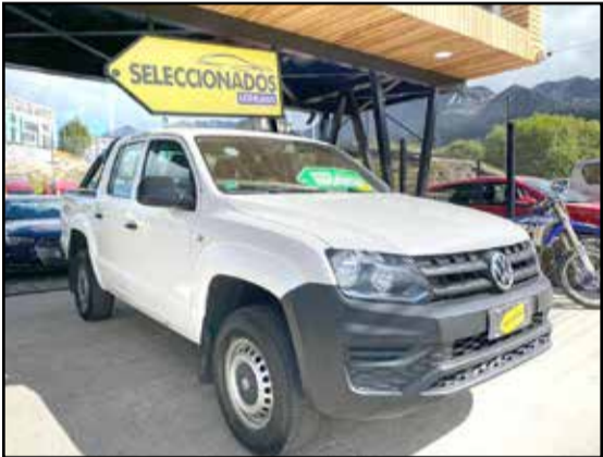
AMAROK STARLINE 140CV 4X4 MT 2017 KM 85000. $ 4.690.000