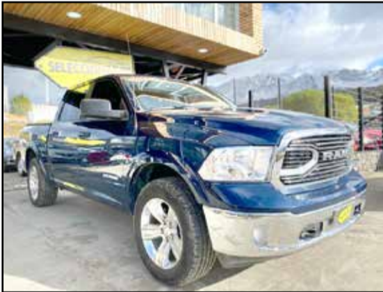
RAM LARAMIE 4X4 AT 2020 KM 10000. $ 8.990.000