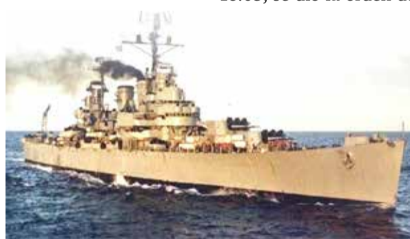
Crucero ARA "General Belgrano"

Los buques recogieron un total de 793 de los 1.093 tripulantes, de los que resultaban 23 fallecidos en las balsas, y otros 300 en el propio naufragio.