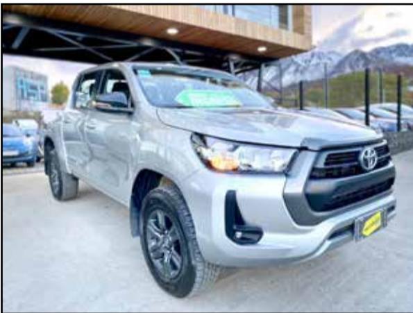
HILUX SR 4X4 DC MT 2022 KM 2000. $ 7.600.000