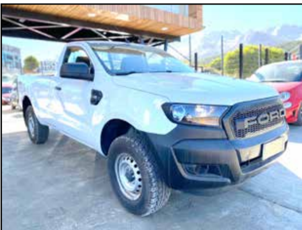
FORD RANGER 2.2 CS 4X4 MT 2019 KM 12000. $ 4.900.000