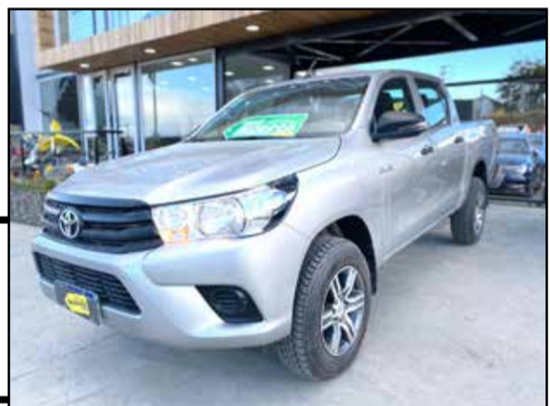
HILUX DX 4X4 DC MT 0 KM. $ 6.990.000