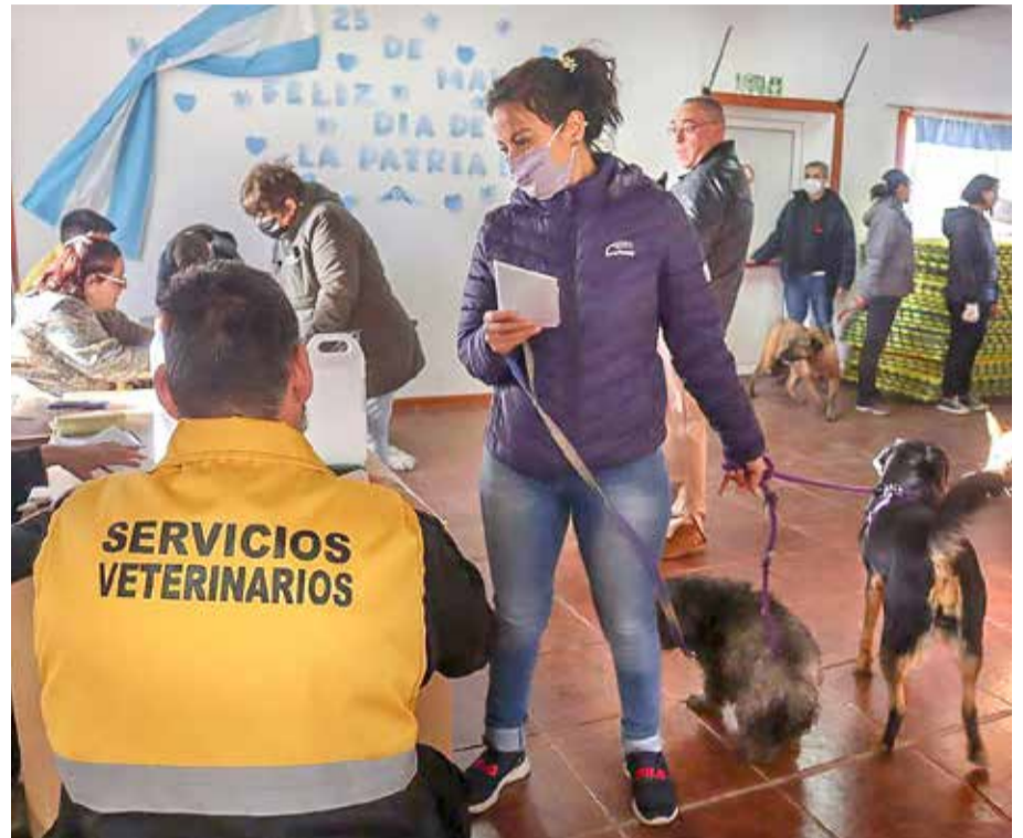
rentes políticas, la salud de la población", dijeron desde el Municipio.

desarrolló el operativo, lo cual, sumado a la primera jornada que se llevó adelante en el mes de marzo en Chacra II, da un total, al momento, de 800 mascotas que ya tienen su dosis antirrábica. "De esta manera, se busca afianzar a Río Grande como ciudad mascotera y responsable, tanto con los animales como con el entorno, mejorando así la calidad de vida de todos y todas y cuidando, a través de dife-