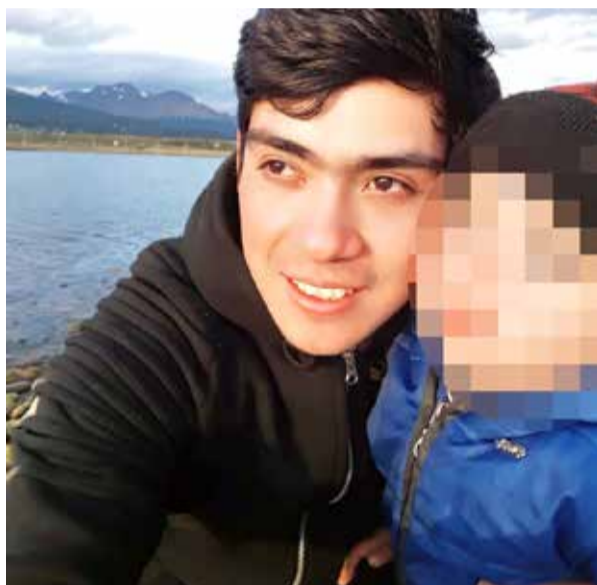
su familia, residente en