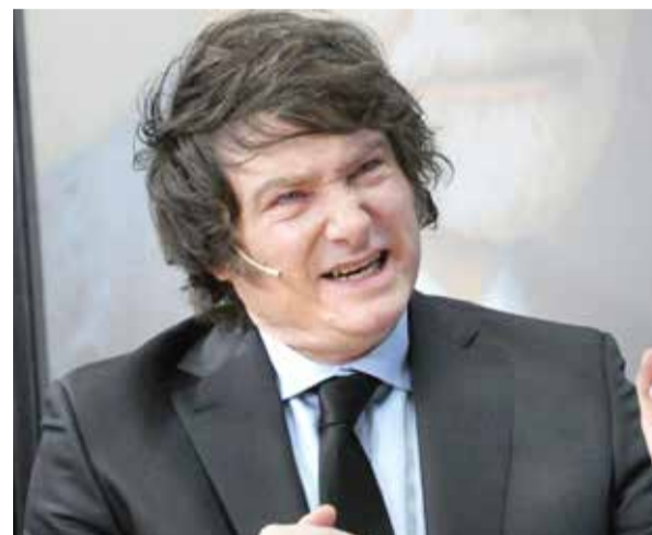
Diputado nacional por Libertad Avanza, Javier Milei

En una entrevista al canal de noticias TN, el diputado nacional por Libertad Avanza, Javier Milei, aseguró que el régimen industrial de Tierra del Fuego "es una estafa a los argentinos de bien" y afirmó que "si fuera presidente" desecharía la Ley de promoción.