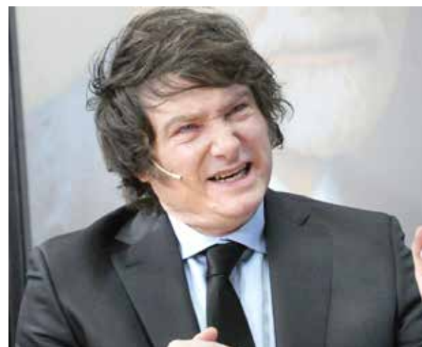
Diputado nacional por Libertad Avanza, Javier Milei

En una entrevista al canal de noticias TN, el diputado nacional por Libertad Avanza, Javier Milei, aseguró que el régimen industrial de Tierra del Fuego "es una estafa a los argentinos de bien" y afirmó que "si fuera presidente" desecharía la Ley de promoción.