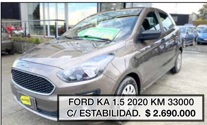
FORD KA 1.5 2020 KM 33000 C/ ESTABILIDAD. $ 2.690.000