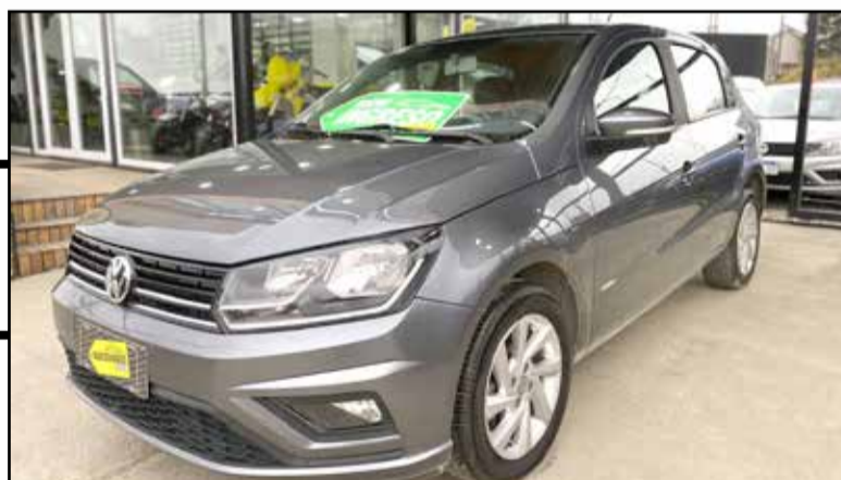
VOLKSWAGEN GOL TREND COMFORT. 2020 KM 19000. $ 3.100.000