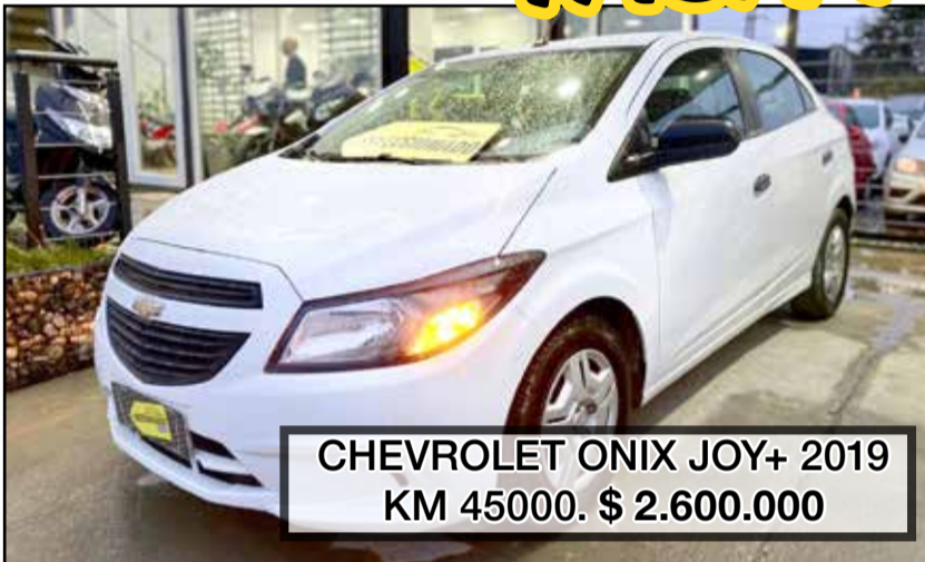
CHEVROLET ONIX JOY+ 2019 KM 45000. $ 2.600.000