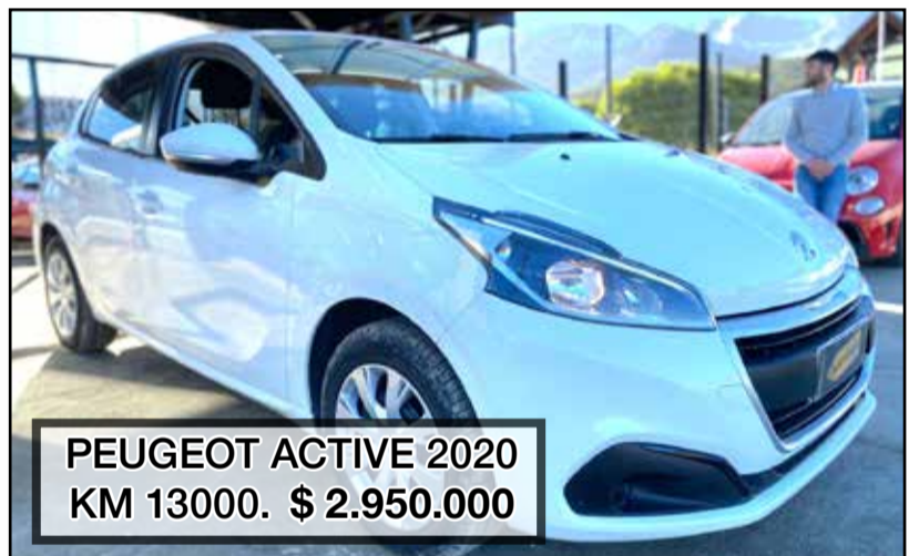
PEUGEOT ACTIVE 2020 KM 13000. $ 2.950.000