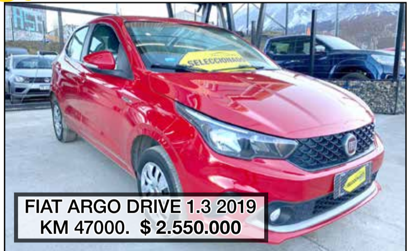
FIAT ARGO DRIVE 1.3 2019 KM 47000. $ 2.550.000