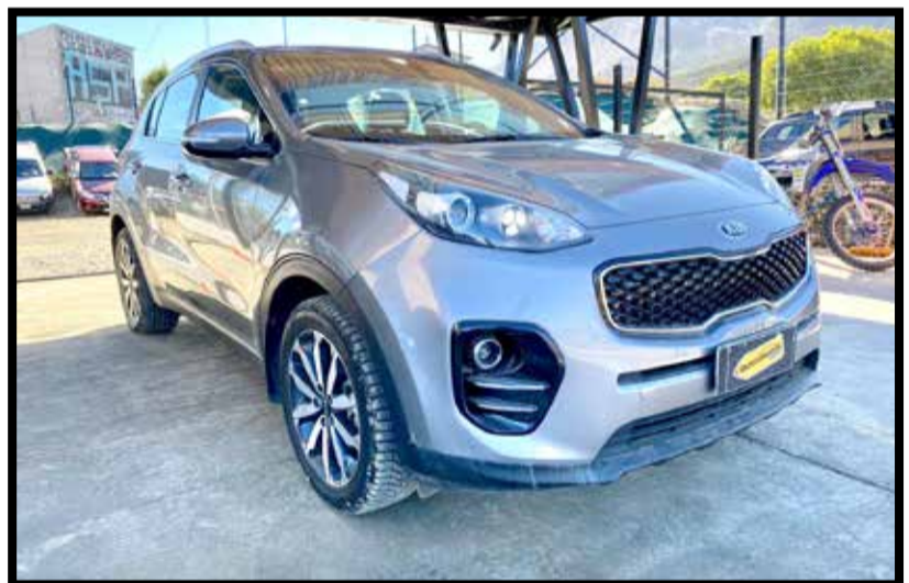
KIA SPORTAGE 2018 AT 4X2 KM 50000. ENTREGA MINIMA DESDE $ 1.990.000