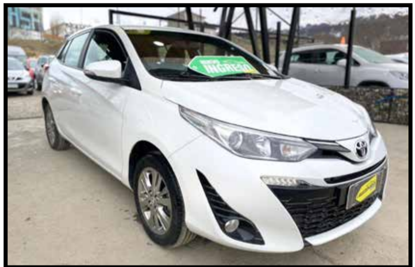
TOYOTA YARIS XLS AT. 2020 KM 13000. ENTREGA MINIMA DESDE $ 1.500.000