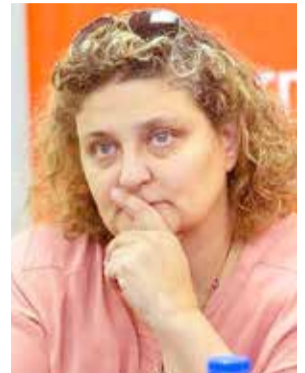
Ministra Sonia Castiglione

"Por otro lado, hablaron sobre cómo seguir a futuro. Dependiendo de la empresa, de la relación con los proveedores, de dónde está el provee-