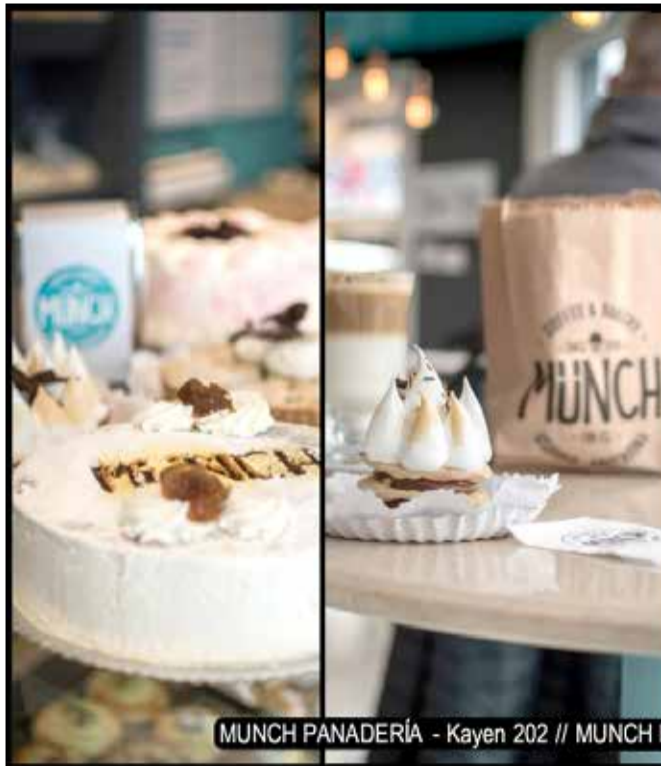
MUNCH PANADERÍA - Kayen 202 // MUNCH HELADERÍA San Martín 287