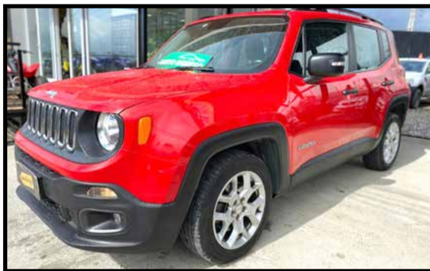
JEEP RENEGADE 2019 KM 42000. ENTREGA MÍNIMA DESDE 1.500.000