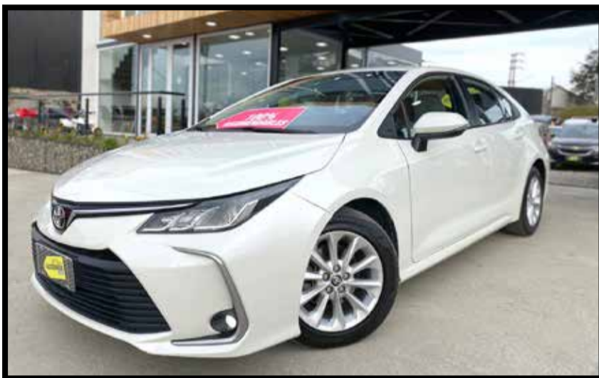
TOYOTA COROLLA XLI AT 2021 KM 35000. ENTREGA MINIMA DESDE $ 1.800.000