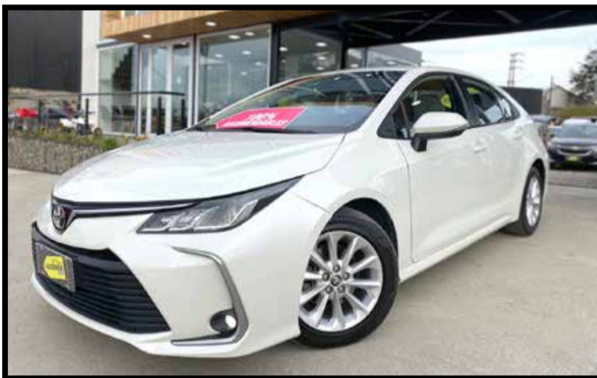
TOYOTA COROLLA XLI AT 2021 KM 35000. ENTREGA MINIMA DESDE $ 1.800.000