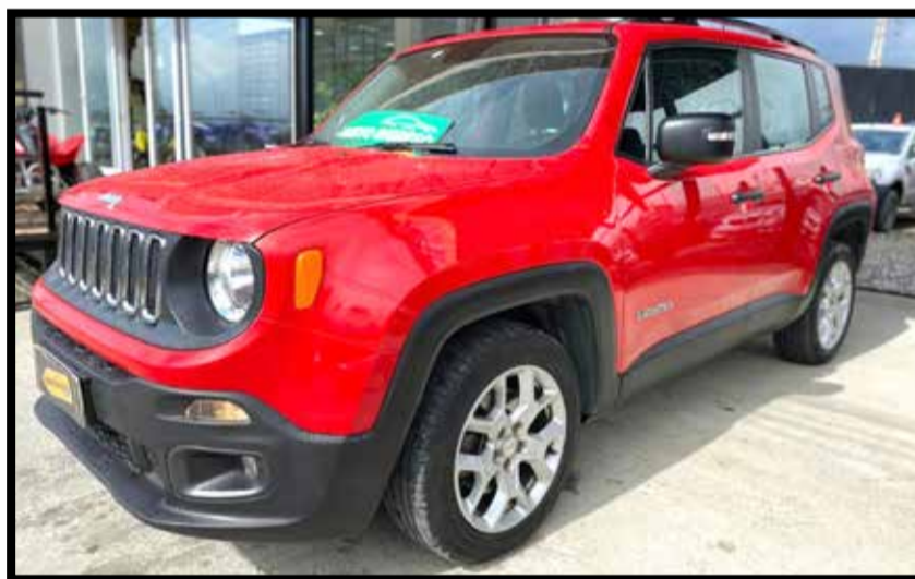
JEEP RENEGADE 2019 KM 42000. ENTREGA MÍNIMA DESDE 1.500.000