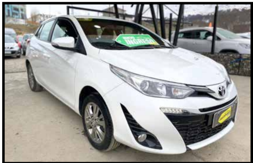
TOYOTA YARIS XLS AT. 2020 KM 13000. ENTREGA MINIMA DESDE $ 1.500.000