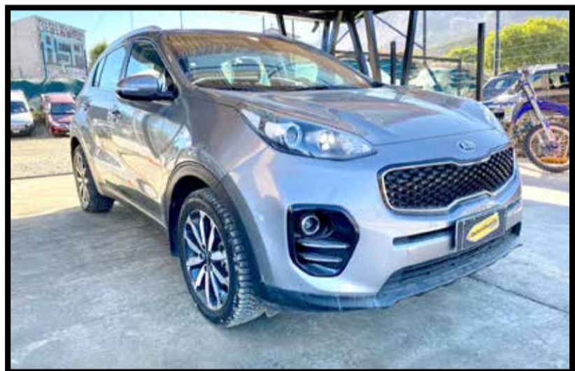
KIA SPORTAGE 2018 AT 4X2 KM 50000. ENTREGA MINIMA DESDE $ 1.990.000