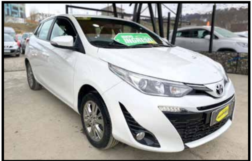
TOYOTA YARIS XLS AT. 2020 KM 13000. ENTREGA MINIMA DESDE $ 1.500.000