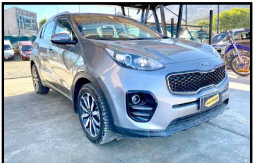
KIA SPORTAGE 2018 AT 4X2 KM 50000. ENTREGA MINIMA DESDE $ 1.990.000