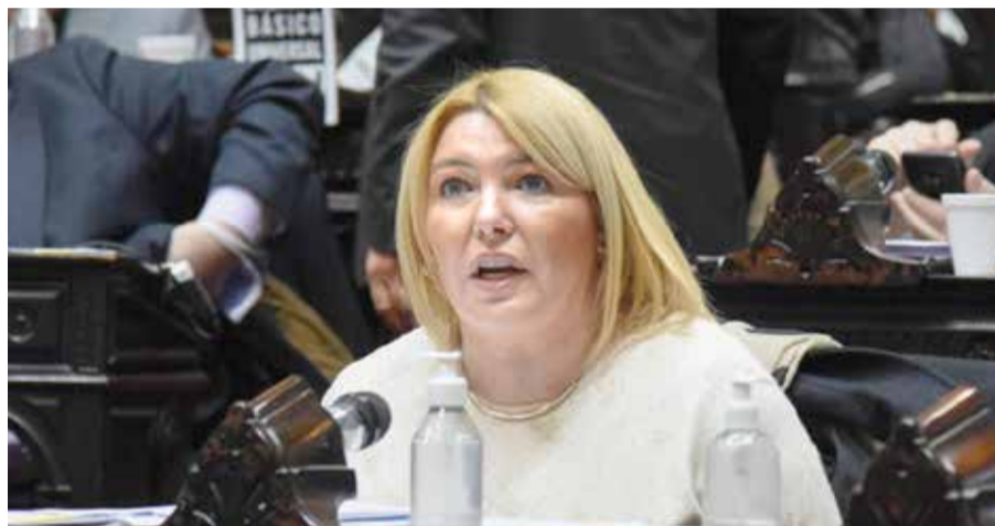
Diputada nacional por Tierra del Fuego, Rosana Bertone

es el que atravesamos, resulta muy importante dejar las diferencias de lado y trabajar por el bienestar del conjunto”. La abogada nacida en Entre Ríos hace 50 años, subrayó su vocación institucionalista y pidió “respetar la investidura presidencial y la de todos los mandatarios electos por el pueblo”. Acto seguido realizó una descripción de