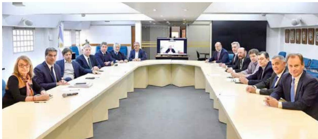
Los gobernadores oficialistas estuvieron, primero, en el CFI. Después se desplazaron rumbo a la Casa Rosada.

“El presidente Alberto Fernández nos ha ma-