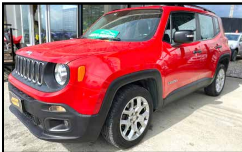
JEEP RENEGADE 2019 KM 42000. ENTREGA MÍNIMA DESDE 1.500.000