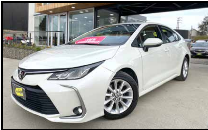
TOYOTA COROLLA XLI AT 2021 KM 35000. ENTREGA MINIMA DESDE $ 1.800.000