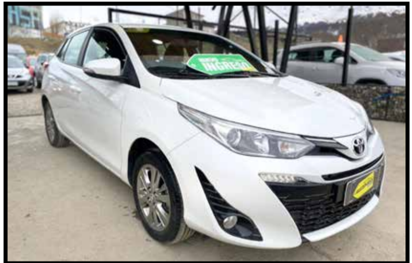
TOYOTA YARIS XLS AT. 2020 KM 13000. ENTREGA MINIMA DESDE $ 1.500.000