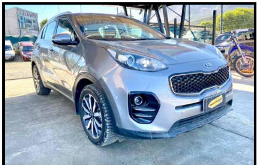
KIA SPORTAGE 2018 AT 4X2 KM 50000. ENTREGA MINIMA DESDE $ 1.990.000