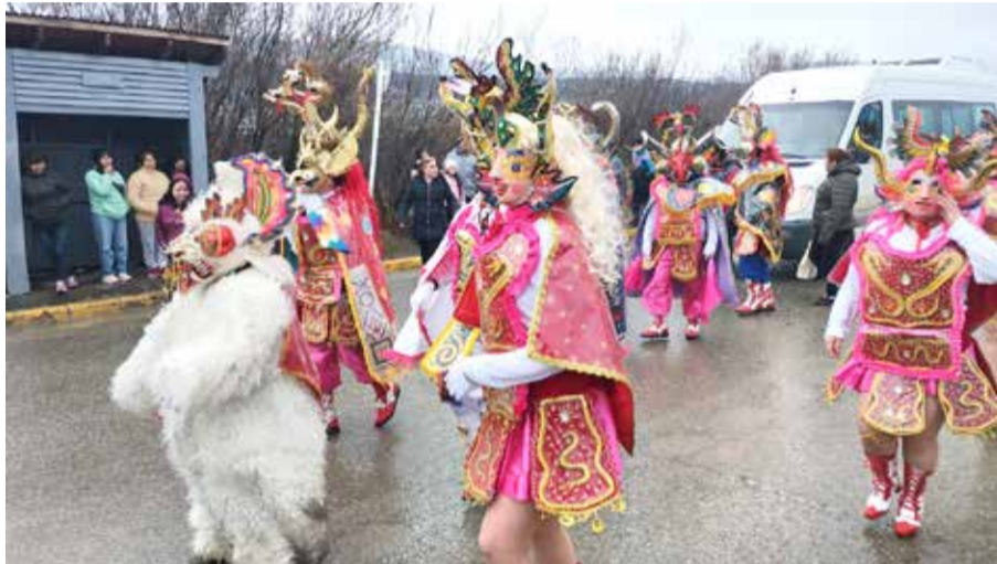
Los bailarines danzan cubriendo sus rostros con máscaras y cascos con cuernos, detrás de quien simula ser un animal, un becerro, una llama o una alpaca blanca. Los elementos forman parte de la rica cultura boliviana, atravesada por la influencia española, quechua, aymará y guaraní, entre tantas otras etnias.