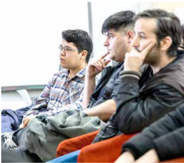
Argentina Programa, con la cual podrán adquirir una computadora que les

la posibilidad de acompañar a los y las estudiantes fueguinas con la entrega de las tarjetas y manifestó que “me gustaría simplemente dejarles un gran saludo de nuestra parte, agradecerles la posibilidad de poder acompañar nuevamente a la provincia en todas estas iniciativas”. “Para nosotros es un placer y, sobre todo, me gustaría destacar el rol del Gobierno de Tierra del Fuego, que ha desarrollado una política brillante para impulsar el sector de la economía del conocimiento”, concluyó.