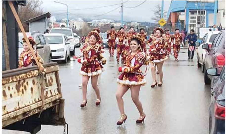
Vistiendo trajes impecablemente bordados, con incrustaciones de piedras, cintas y borlas, con el brillo y la estridencia de colores como factor común, los residentes bolivianos exhibieron sus danzas típicas en las calles de Ushuaia.