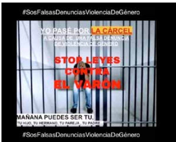
Febré no solo se representó a sí mismo en juicio sino también en las redes sociales en donde difundió un video en el que acusó a su esposa de "haberme sometido utilizando su brillante papel de mujer sufrida y golpeada".

me ha manipulado sino a todas las personas con las que se relaciona". El letrado deberá ahora decidir si apela la condena a la que fue sometido, luego de que el juez formule los fundamentos que lo llevaron a aplicarle la mitad de la pena que había solicitado el fiscal Martín Bramatti, el próximo lunes 22 de agosto.