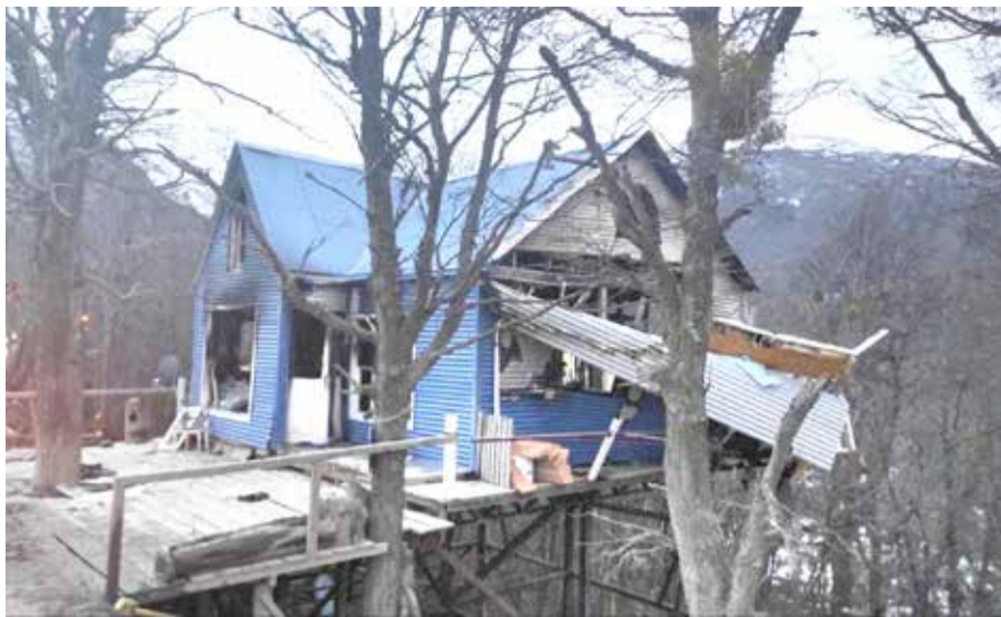
La explosión de un calefón puede causar daños devastadores, por lo que se recomienda prestarle constante atención a su funcionamiento y realizarle controles, como mínimo anuales, con un gasista matriculado.