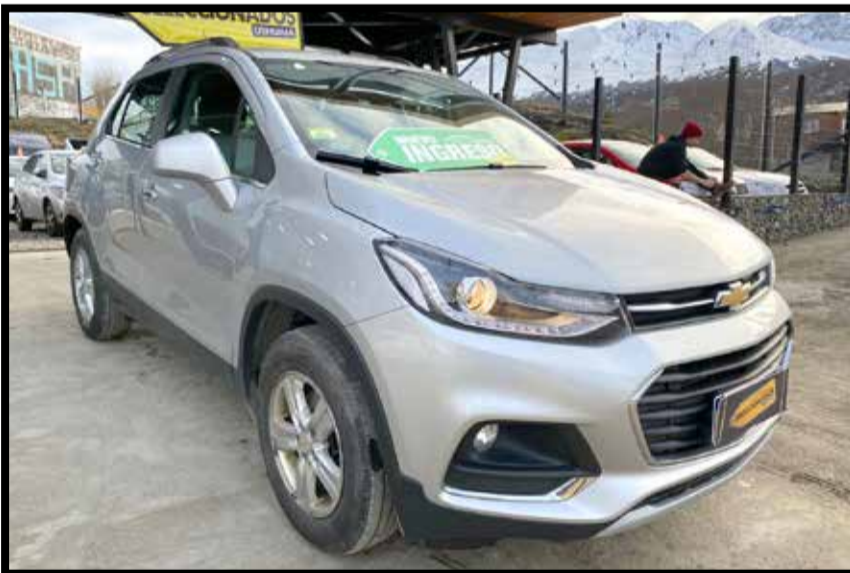
CHEVROLET TRACKER 2018 KM 45000. CAJA MANUAL 4X2. ENTREGA MÍNIMA DESDE 1.500.000. FINANCIACIÓN HASTA EN 60 CUOTAS FIJAS.