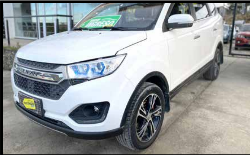
LIFAN MY WAY 7 ASIENTOS 2020 KM 23000. ENTREGA MÍNIMA DESDE 1.790.000. FINANCIACIÓN HASTA EN 60 CUOTAS FIJAS.