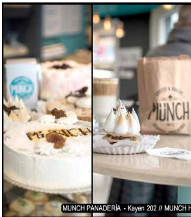
MUNCH PANADERÍA - Kayen 202 // MUNCH HELADERÍA San Martín 287

de la palabra para contar el artista local "Eros Es-anécdotas de la Ushuaia pósito" y el conjunto fol-clórico "Alma Cantora" de antaño. Para cerrar el encuentro amenizaron el momento