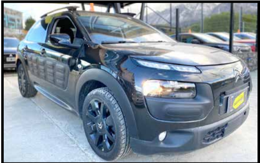
C4 CACTUS 1.2 AT SHINE 2017 KM 65000. ENTREGA MÍNIMA DESDE 1.290.000. FINANCIACIÓN HASTA EN 60 CUOTAS FIJAS.