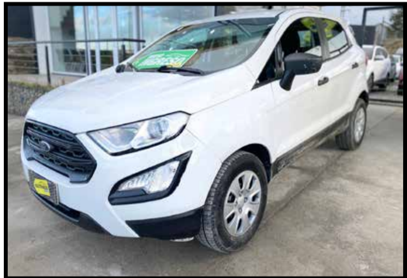
FORD ECO SPORT 1.5 2018 KM 49000. ENTREGA MÍNIMA DESDE 1.500.000. FINANCIACIÓN HASTA EN 60 CUOTAS FIJAS.