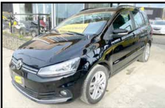
VOLKSWAGEN SURAN HIGHLINE 2019 KM 80000

MANTENEMOS 43% TASA FIJA (SUJETO A APROBACION BANCARIA)