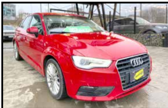
AUDI A3 SPORTBACK 1.8T 2014 KM 90000