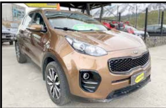
KIA SPORTAGE EX 2.0 AT 2018 KM 45000