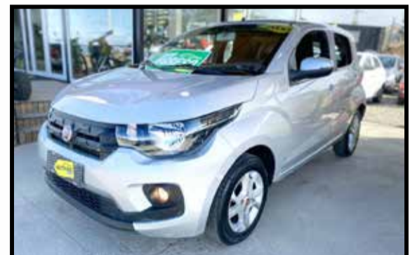
FIAT MOBI EASY 2018 KM 50000