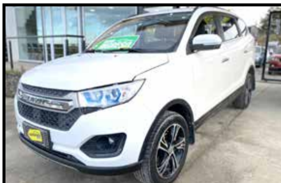
LIFAN MYWAY 7 ASIENTOS 2019 KM 23000