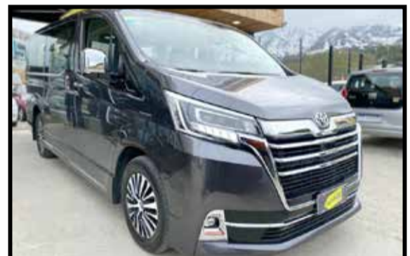
TOYOTA HIACE WAGON 2.8 TDI 6AT 9+1 2021 KM 29000