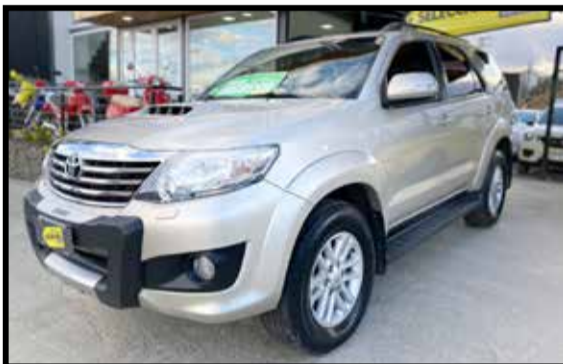
TOYOTA SW4 4X4 SRV 3.0 5 AS. 2013 KM 93000

DESCUENTOS ESPECIALES EN ESTOS SELECCIONADOS Y MUCHO MAS!