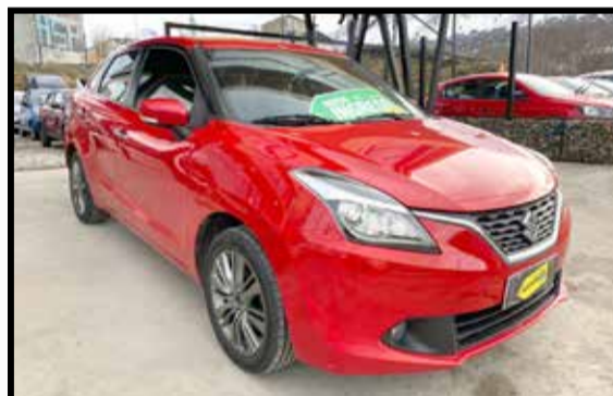
SUZUKI BALENO 2019 KM 57000

MANTENEMOS 43% TASA FIJA (SUJETO A APROBACION BANCARIA)