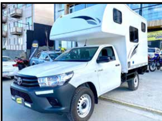
CAMPER 2 ADULTOS + 2 NIÑOS SOBRE TOYOTA 4X4 0KM