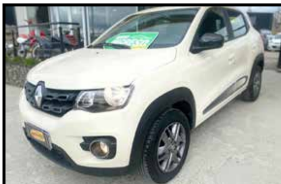
RENAULT KWID ICONIC 2020 KM 10000