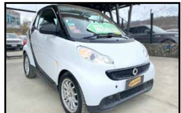
SMART FORTWO CITY 2013 KM 60000