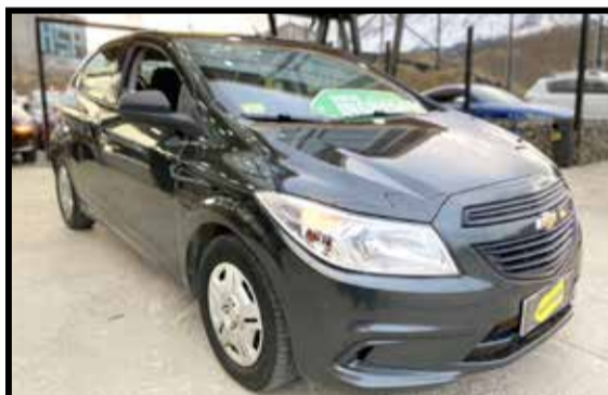
CHEVROLET ONIX JOY+ 2018 KM 37000

MANTENEMOS 43% TASA FIJA (SUJETO A APROBACION BANCARIA)