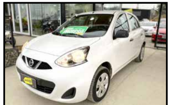
NISSAN MARCH ACT PURE DRIVE 1.6 2018 KM 45000