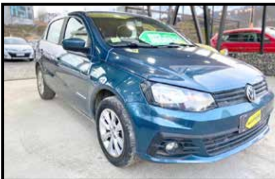
VOLKSWAGEN GOL TREND COMF. 2018 KM 57000

MANTENEMOS 43% TASA FIJA (SUJETO A APROBACION BANCARIA)