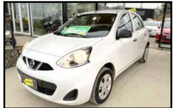
NISSAN MARCH ACT PURE DRIVE 1.6 2018 KM 45000