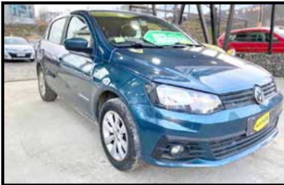
VOLKSWAGEN GOL TREND COMF. 2018 KM 57000

MANTENEMOS 43% TASA FIJA (SUJETO A APROBACION BANCARIA)