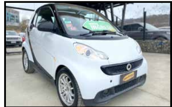
SMART FORTWO CITY 2013 KM 60000