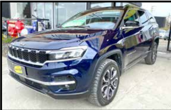
JEEP COMMANDER LIMITED 2.0 4X4 AT