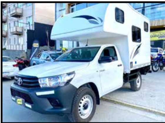
CAMPER 2 ADULTOS + 2 NIÑOS SOBRE TOYOTA 4X4 0KM