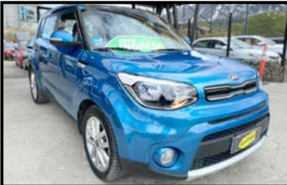
KIA SOUL EX AT 2018 KM 35000

DESCUENTOS ESPECIALES EN ESTOS SELECCIONADOS Y MUCHO MAS!