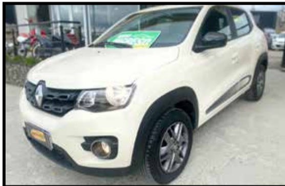
RENAULT KWID ICONIC 2020 KM 10000