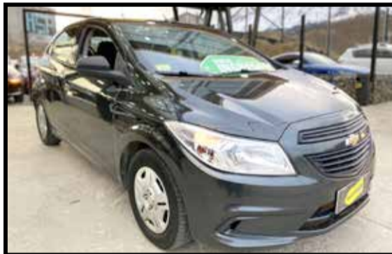
CHEVROLET ONIX JOY+ 2018 KM 37000

MANTENEMOS 43% TASA FIJA (SUJETO A APROBACION BANCARIA)