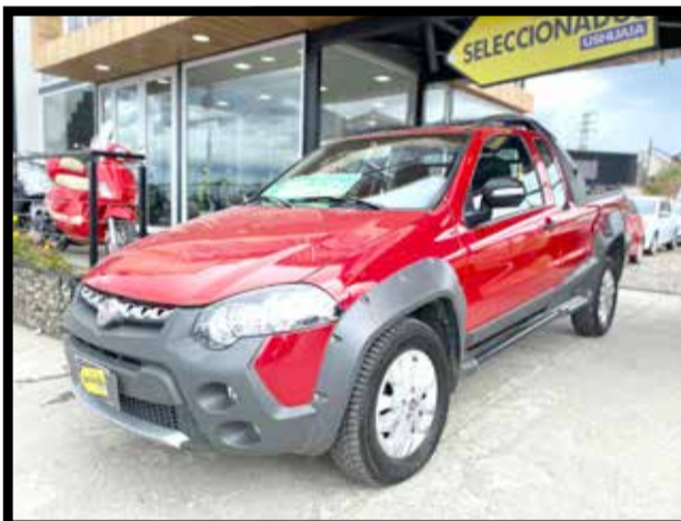
FIAT STRADA ADVENTURE 2013 53.000 KM

BONIFICACIONES ENTRE 100 MIL Y 150 MIL PESOS!