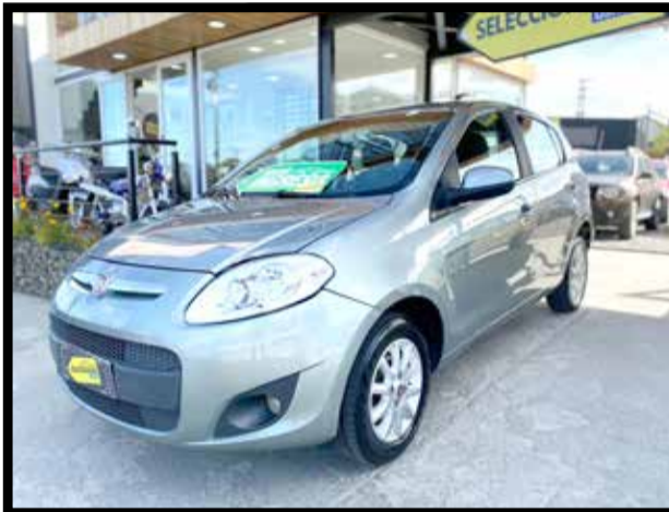
FIAT PALIO ATTRACTIVE 2018 35.000 KM

TASA FIJA AL 45% (SUJETO A APROBACIÓN BANCARIA)