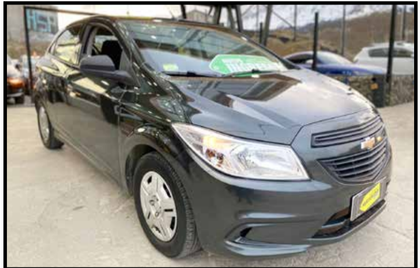
CHEVROLET ONIX JOY+ 2018 KM 37.000