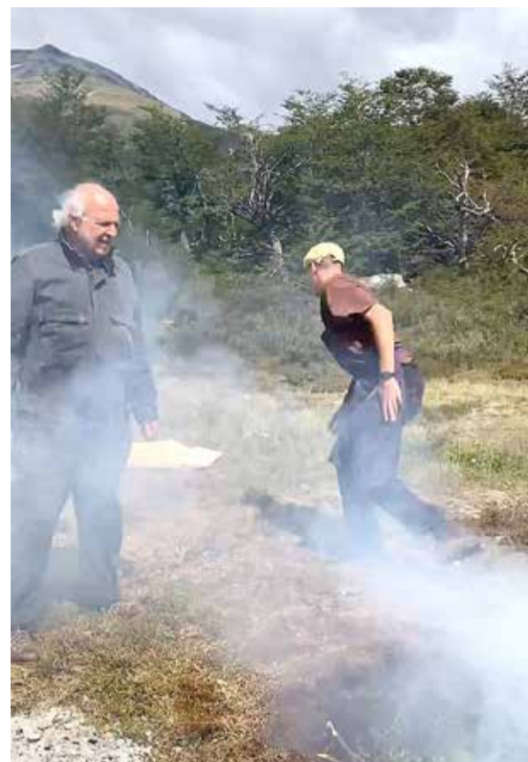
El pasado 18 de diciembre, el famoso chef Francis Mallmann descendió de un crucero junto a otras personas. Fueron recibidos en un local gastronómico ushuaiese cuyos responsables les permitieron cavar un pozo, prender fuego y hacer un curanto chileno, ignorando la Ley Provincial 1457/22, que declara la Emergencia Ambiental por Incendios Forestales en todo el territorio de la provincia hasta el 30 de junio de 2023 inclusive.

Con respecto a la activación del protocolo cuando inició el fuego, explicó que "la planificación se llevó adelante como estaba prevista. Es importante que se entienda que la convocatoria de los voluntarios se estima cuando el Comité de Emergencia lo considera seguro y adecuado". Finalmente, expuso que siguen "abocados en sofocar el incendio y en poder controlarlo, además estamos a la expectativa de los resultados de la investigación que está llevando a cabo la Justicia".