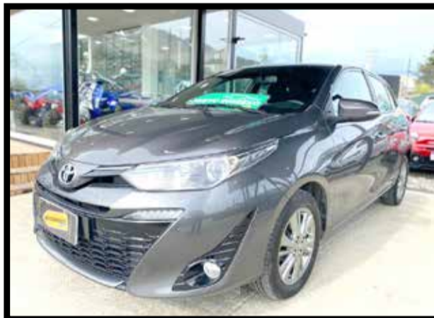
TOYOTA YARIS XLS CVT 2021 23.000 KM

BONIFICACIONES ENTRE 100 MIL Y 150 MIL PESOS!