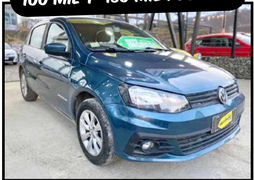
VOLKSWAGEN GOL TREND COMF. 2018 KM 57.000