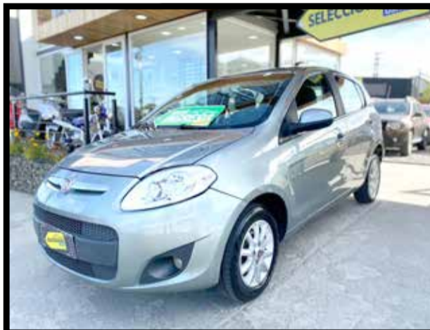
FIAT PALIO ATTRACTIVE 2018 35.000 KM

TASA FIJA AL 45% (SUJETO A APROBACIÓN BANCARIA)