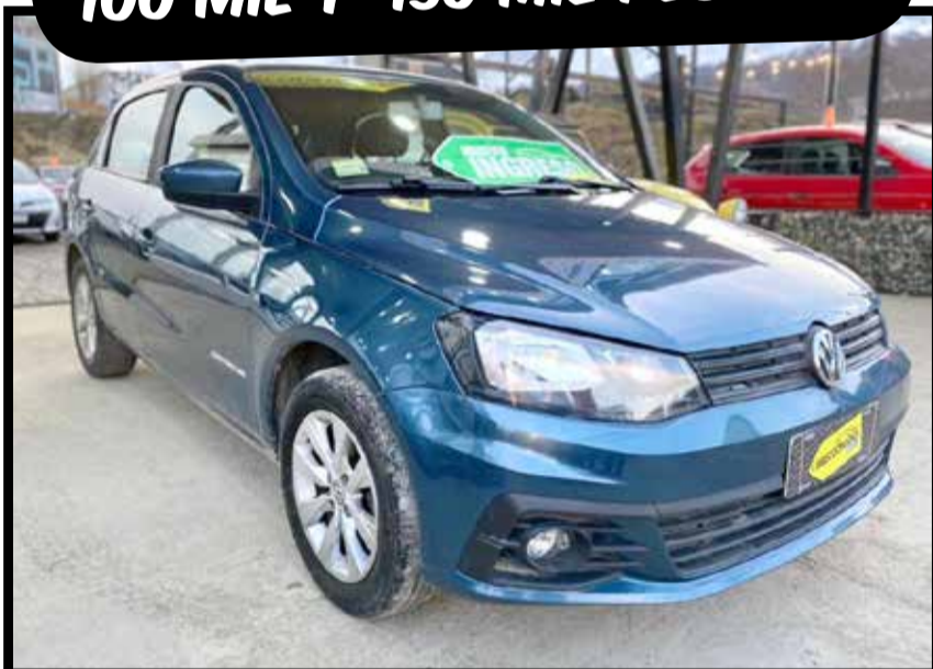
VOLKSWAGEN GOL TREND COMF. 2018 KM 57.000