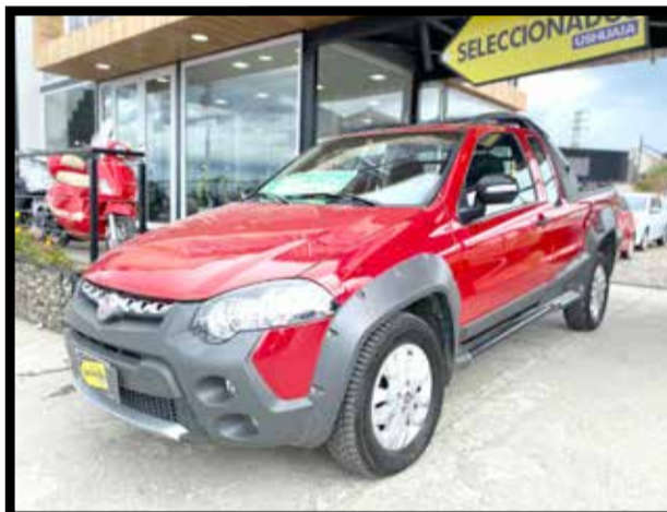
FIAT STRADA ADVENTURE 2013 53.000 KM

BONIFICACIONES ENTRE 100 MIL Y 150 MIL PESOS!