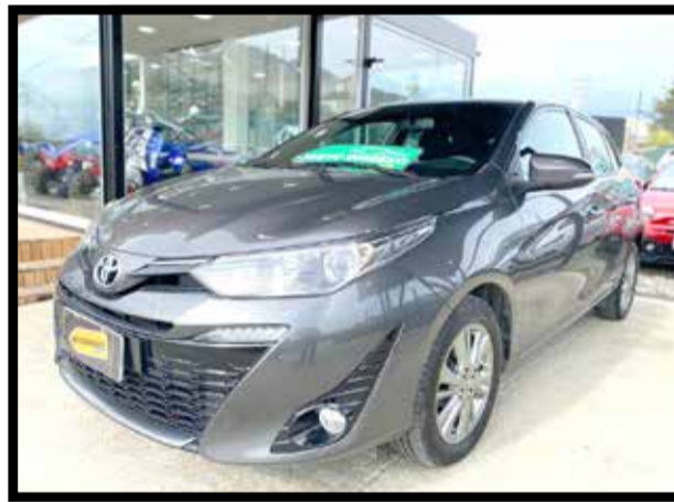
TOYOTA YARIS XLS CVT 2021 23.000 KM

BONIFICACIONES ENTRE 100 MIL Y 150 MIL PESOS!