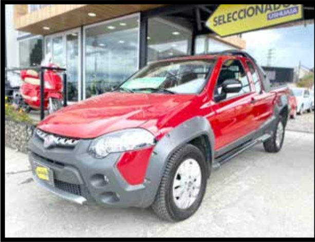
FIAT STRADA ADVENTURE 2013 53.000 KM

BONIFICACIONES ENTRE 100 MIL Y 150 MIL PESOS!