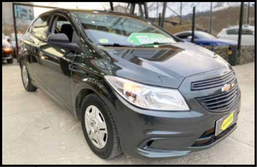
CHEVROLET ONIX JOY+ 2018 KM 37.000