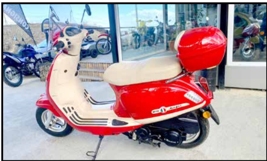
ALLEGRO 150CC. ENTREGA $ 150.000. SALDO EN CUOTAS