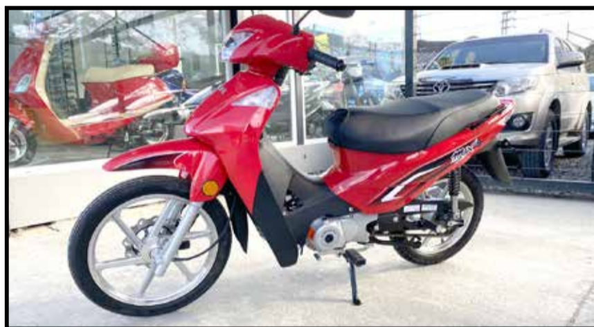
LD 110 MAX. ENTREGA $ 100.000. SALDO EN CUOTAS