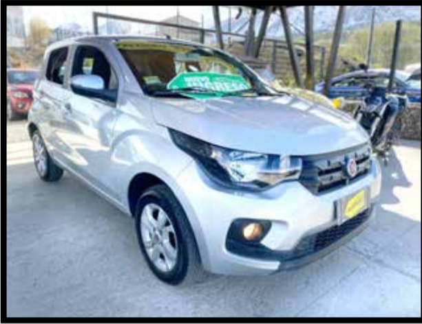
FIAT MOBI EASY 1.0 - 2018 45.000 KM

TASA FIJA AL 45% (SUJETO A APROBACIÓN BANCARIA)