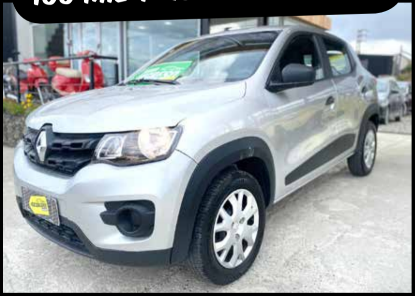
RENAULT KWID LIFE 1.0 - 2018 22.000 KM