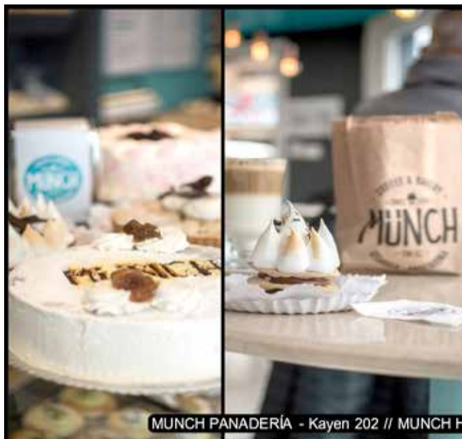
MUNCH PANADERIA - Kayen 202 // MUNCH HELADERIA San Martín 287

VENDO EQUIPO USADO (10 AÑOS) RX MOEDELLO PROMAX 3D MARCA PLANMECA. U$S 52000. CONTACTARSE DE L. A V. DE 15 A 18 H. AL (2901) 516655 o (2901) 494208