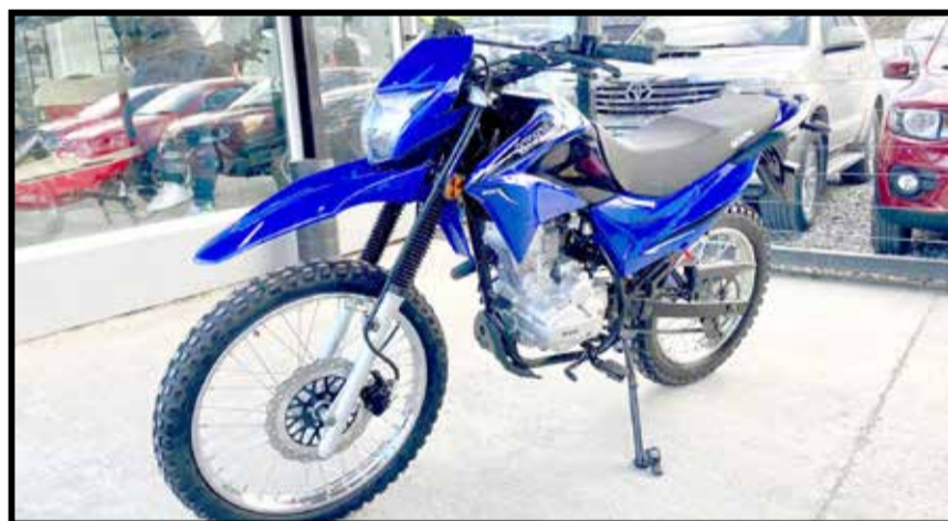
TD 150. ENTREGA $ 120.000. SALDO EN CUOTAS