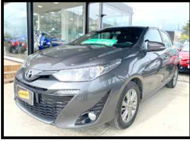
TOYOTA YARIS XLS CVT 2021 23.000 KM

BONIFICACIONES ENTRE 100 MIL Y 150 MIL PESOS!