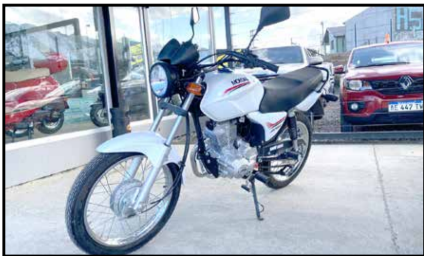
RD 150. ENTREGA $ 120.000. SALDO EN CUOTAS