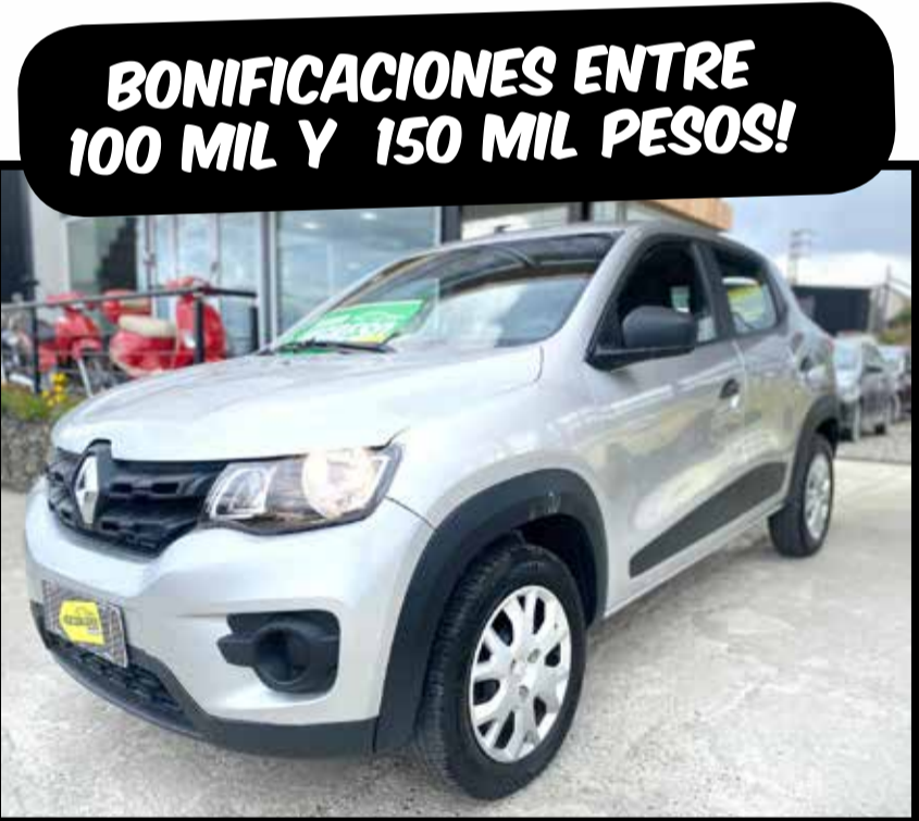
RENAULT KWID LIFE 1.0 - 2018 22.000 KM