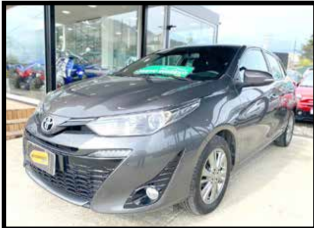
TOYOTA YARIS XLS CVT 2021 23.000 KM

BONIFICACIONES ENTRE 100 MIL Y 150 MIL PESOS!