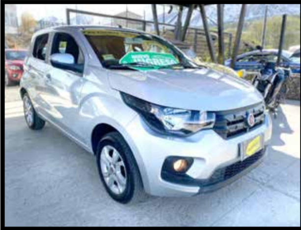
FIAT MOBI EASY 1.0 - 2018 45.000 KM

TASA FIJA AL 45% (SUJETO A APROBACIÓN BANCARIA)