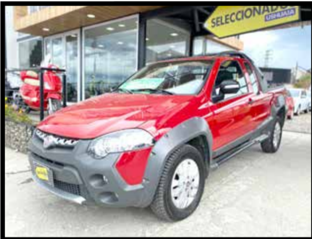
FIAT STRADA ADVENTURE 2013 53.000 KM