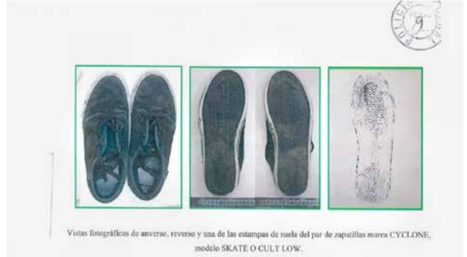
Vistas fotográficas de anverso, reverso y una de las estampas de suela del par de zapatillas marca CYCLONE, modelo SKATE O CULT LOW.

obteníamos éxitos con el levantamiento de huellas papilares (dactilares). Por tener un clima subpolar ártico, andar con guantes en las manos es natural. Esos resultados infructuosos nos llevaron a tener que valernos de alternativas, y fue entonces cuando busca-