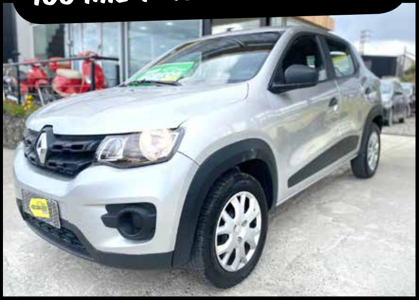
RENAULT KWID LIFE 1.0 - 2018 22.000 KM