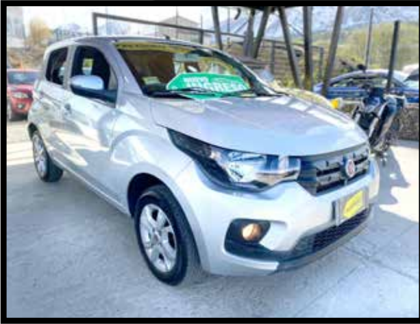
FIAT MOBI EASY 1.0 - 2018 45.000 KM

TASA FIJA AL 45% (SUJETO A APROBACIÓN BANCARIA)