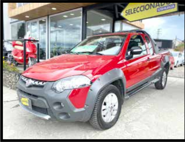
FIAT STRADA ADVENTURE 2013 53.000 KM

BONIFICACIONES ENTRE 100 MIL Y 150 MIL PESOS!