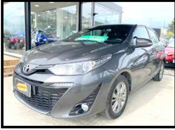
TOYOTA YARIS XLS CVT 2021 23.000 KM

BONIFICACIONES ENTRE 100 MIL Y 150 MIL PESOS!